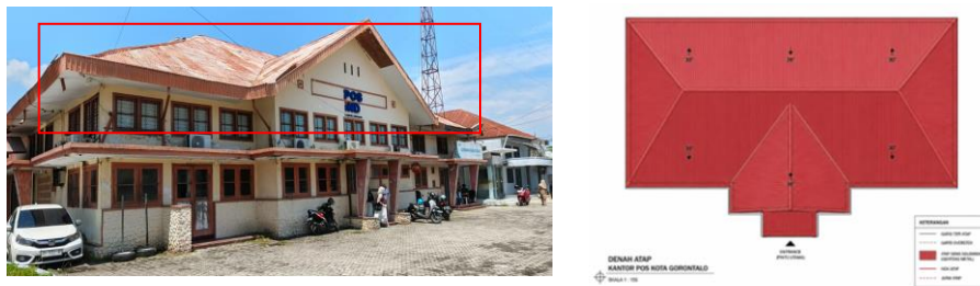
Gambar 2. Atap Bangunan Kantor Pos