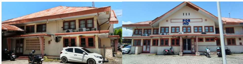
Gambar 4. Dinding bangunan Kantor Pos