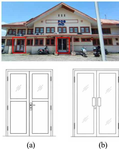
Gambar 7. Jendela bangunan Kantor Pos