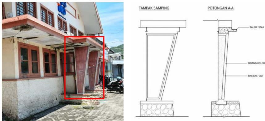
Gambar 5. Kolom Dinding bangunan Kantor Pos