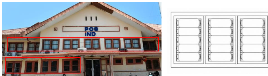
Gambar 6. Jendela bangunan Kantor Pos